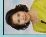
*永遠榮譽會長 何煥賢太平紳士